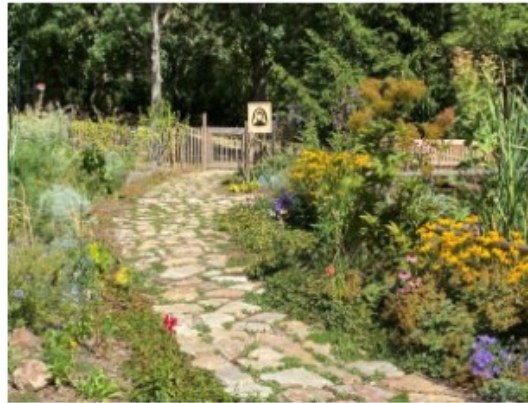
„Hildegarten“ von Schöneberg

Samstag, 21. Oktober 2023 Binger Hildegardweg