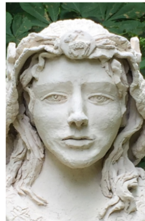
„Jungfrau Hildegard“ von Annette Esser, 2013

Scivias-Institut für Kunst und Spiritualität e.V.