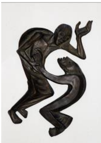
Thomas begegnet dem auferstandenen Jesus.